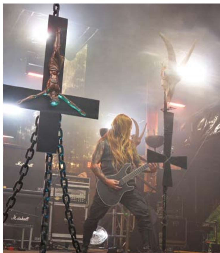
Dėl savo radikalių muzikos, iškrėpėlišku tekstų, prieš dogmines normas nukreiptų pažiūrų austrų grupė „BELPHEGOR“ ne kartą buvo neįleista į kai kurias pasaulio valstybes.

Su kauniečiais upės šienavimo sutartis sudaryta dar 2021 metais.