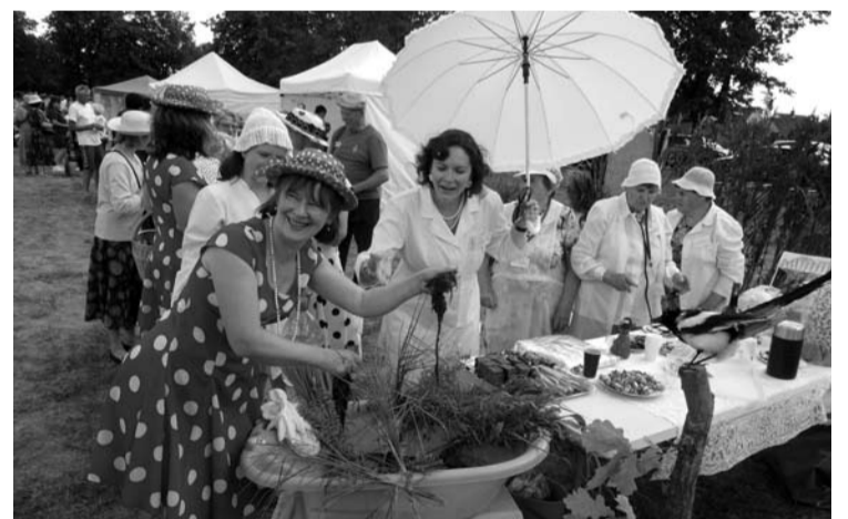
Naujiena – legendą turinčio Budrių ežero dumblo ir purvo vona.