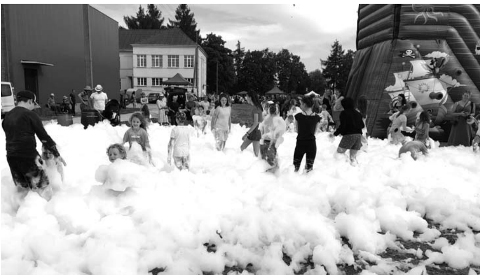
Vaikai irgi buvo itin pamaloninti: kalnai švelniųjų muilo putų suteikė daug džiaugsmo.