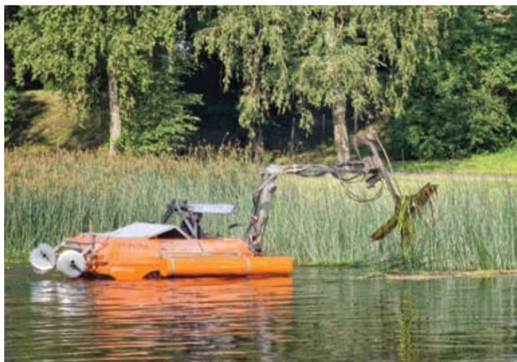
Iki savaitgalį vykstančios Anykščių miesto šventės Šventosios upės atkarpa nuo užtvankos iki bažnyčios bus išvaduota nuo žolių.

Darbus atliko Kauno įmonė UAB „Hidro darbai“. Trejų metų upės šienavimo sutarties vertė – 13 tūkst. 350 eurų.