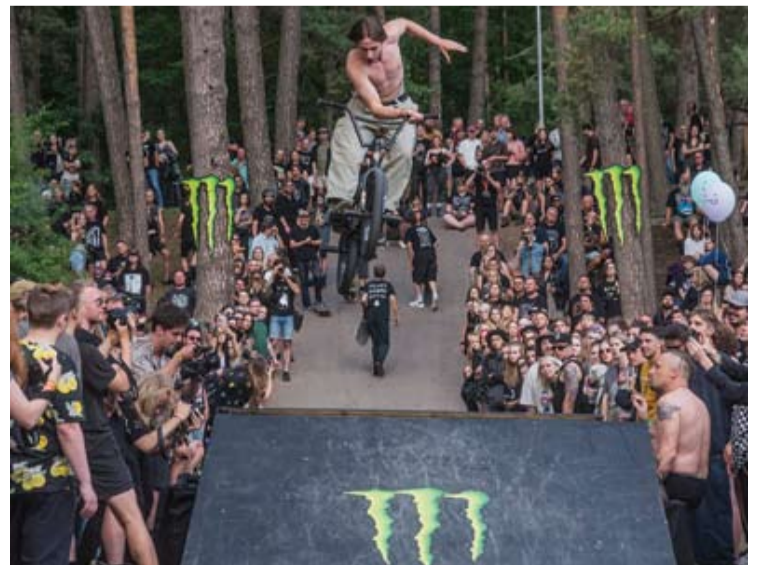
Šeštadienio vakarą trumpam buvo sustabdytas eismas – prie Vakarų scenos skraidė skater'iai ir BMX'eriai, atlikinėdami ekstremalius triukus.

Liepos 13–16 dienomis Anykščiuose, Dainuvos slėnyje, vykęs 13-asis ekstremalaus rokenrolo ir alternatyvios kultūros festivalis „Devilstone“ šiemet ir vėl sukėlė pasipiktinimą tarp tikinčiųjų. Po to, kai savaitgalį portale anyksta.lt pasirodė nuotraukos iš Austrijos grupės „BELPHEGOR“ pasirodymo, dalis skaitytojų piktnosį, kad scenoje atvirai buvo demonstruojama nepagarba katalikų bažnyčios simboliams.