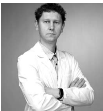
Ortopedas traumatologas J. Vyšumirski džiaugėsi didėjančiu vyresnio amžiaus žmonių sąmoningumu ir savisauga.