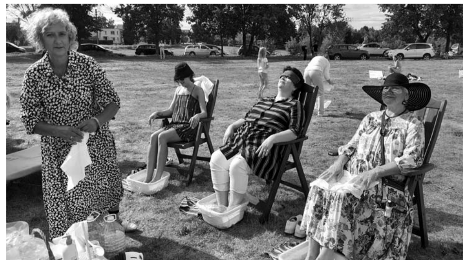
Damos mėgsta išbandyti grožio procedūras.