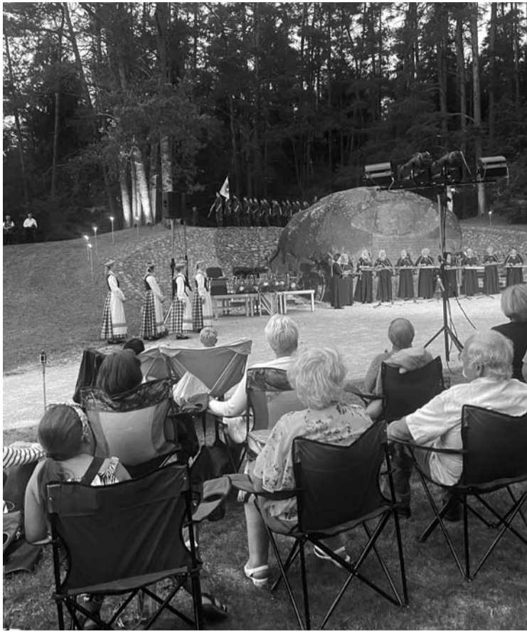
Jaukiai prisimintas neeilinis mūsų šalies istorijos puslapis – „Lituanica“ skrydis per Atlantą 1933 metais.