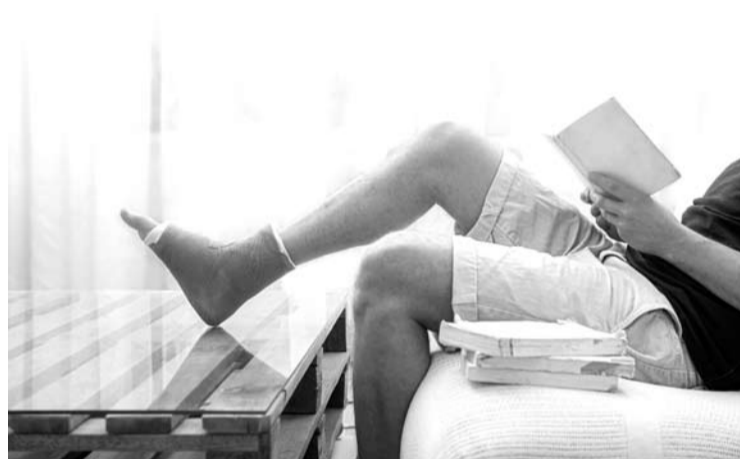
Net ir nesunkios galūnių traumos sukelia nepatogumų kasdienybėje, tad labai svarbu būti atsargiems.

Kiekvienas medicinos specialistas galėtų pritarti teiginiui, jog visavertiška mityba, kokybiškas poilsis, subalansuota neurologinė būklė ir lėtinių ligų kontrolė – tai itin svarbūs veiksniai bendriems sveiko organizmo procesams. Tačiau kalbėdamas apie vyresnio amžiaus žmones ortopedas-traumatologas siūlė pažvelgti plačiau: „Norėdami atsakyti į klausimą, kaip išvengti traumų, turėtume nustatyti priežastį, kodėl nukritus iš neaukštai lūžta kaulas. Mažos kinetinės energijos riešo kaulų, žastikaulio, slankstelių ar šlaunikaulio proksimalinės dalies lūžiai prilyginami osteoporozės diagnozei – kaulų retėjimui. Tad norint išvengti minėtų lūžių, visų pirma reikėtų išsirtinti kaulų tankį ir, esant osteoporozei, gydytis medika-