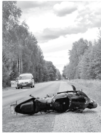
Po avarijos motociklo vairuotojas buvo išgabentas į ligoninę.